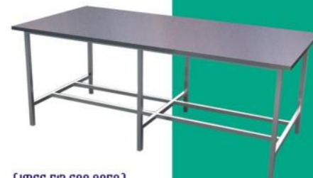
[IMSS 517.609.0958] [IMSS 517.609.1303]