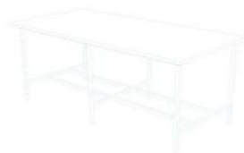
a) Mesa lisa 18cm para doblar ropa. Mesa lisa 18cm para doblar ropa.