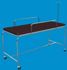
a) Camilla para hospital con portasueros y barandal cromado