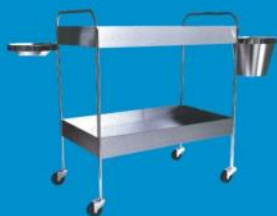
b) Carro para curaciones cromado [IMSS 513.191.0308]