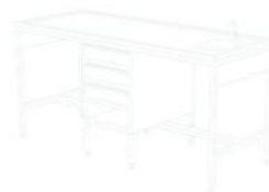
c) Mesa alta de 150, 180, 210cm con escudilla derecha o izquierda y cajonera central. [IMSS 515.619.0133] - [IMSS 515.619.1073] [IMSS 515.619.1081] - [IMSS 515.619.1044] [IMSS 515.619.1099] - [IMSS 515.619.1107]